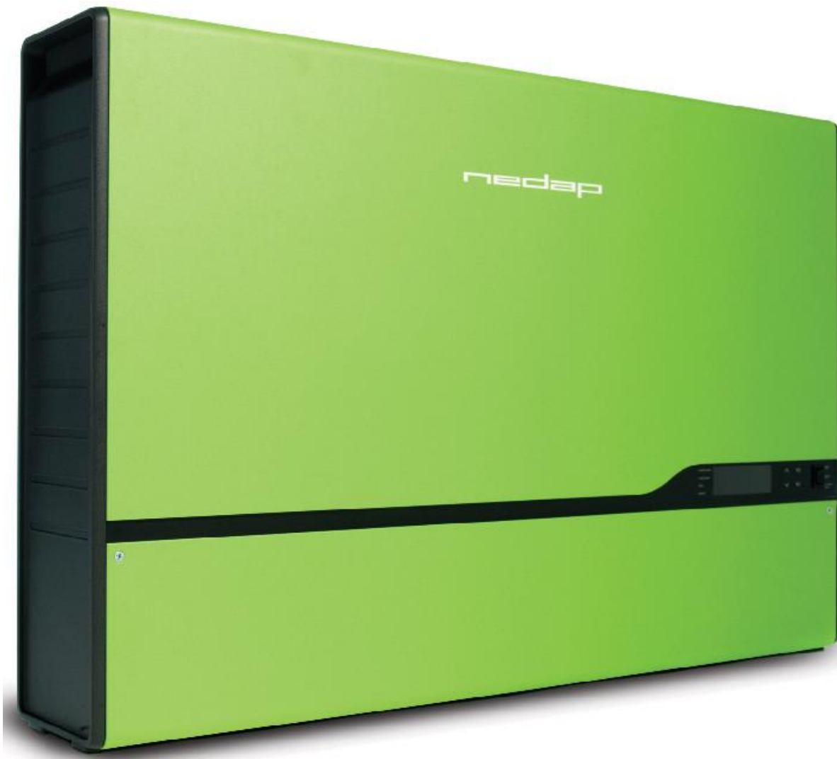
Das Herz des PRIENTAL Heimkraftwerks: der NEDAP PowerRouter

Das PRIENTAL Heimkraftwerk ist die perfekte Lösung für die eigene Stromversorgung – und das ohne Atomkraft, ohne Kohle, ohne Gas, ohne Holz und ohne Erdöl. Allein die Sonne versorgt Sie ab sofort (nahezu) vollständig mit Strom und macht Sie unabhängig von den Stromkonzernen.